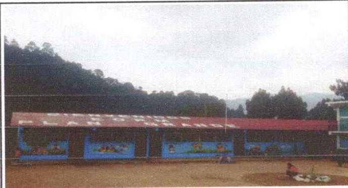
Foto1: Cambio de techo